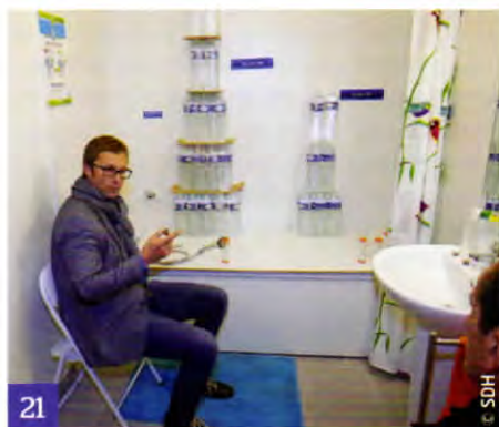
21 Initiation aux éco-gestes dans l'Éco-logis aménagé dans un programme passif.