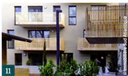
11 Les Sacicap amplifient leur engagement avec l'État.