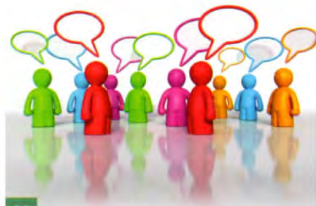
23 Information et transparence pour les copropriétés.