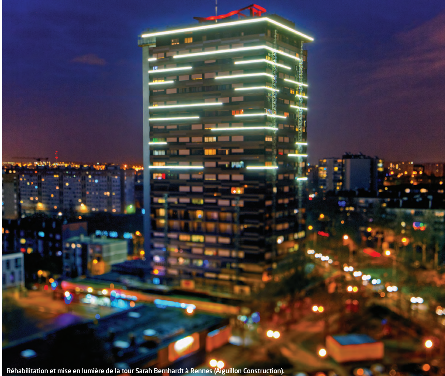
Réhabilitation et mise en lumière de la tour Sarah Bernhardt à Rennes (Aiguillon Construction).